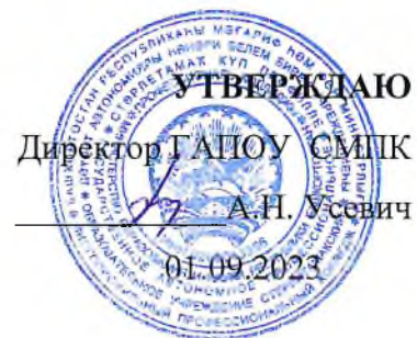
График промежуточной аттестации группы ПНК-20 специальности 44.02.02. Преподавание в начальных классах